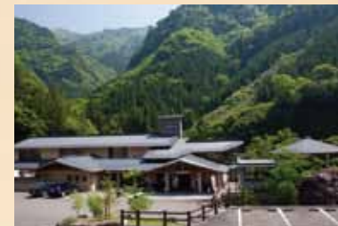
四季美谷温泉 清流・坂州木頭川のほとりで源泉100%の湯源をあげる、ほどよく濃い喉れ湯温泉です。