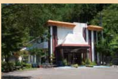
わじき温泉 奇岩が川縁を彩る那賀川の景勝「舞数ライン」。流れのほとりには静かな温泉宿は、景勝を望む客室のほか、夏会場も完備。各種郷土料理も人気です。