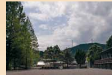
那賀町 鷲数野外活動センター 清流・那賀川が流れる舞数「舞数ライン」のほとりに建つ宿泊施設です。丹生谷地区の豊かな自然にふれてください。