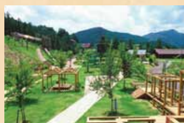
相生森林文化公園あいいらんど 青い水を満々とたたえる川口ダム湖のほとり。深い緑に囲まれた森林公園です。広大な園内には、木の遊具広場やキャンプ場、コテージなどを備えています。