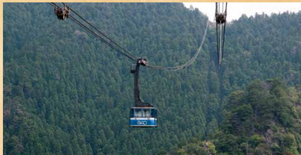
太龍寺ロープウェイ 第21番札所太龍寺のある太龍寺山の麓と山頂を結ぶ全長2775m、101人乗りのロープウェイは日本一の規模。「真の里観光物産センター」が隣接し、お洒落さんや観光客で賑わいます。