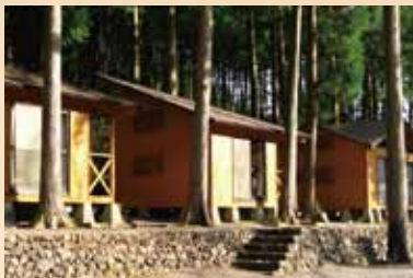
わじきライン間キャンプ村 カヌーやラフティングのメッカ「舞数ライン」に囲み、大自然に開かれたレジャーゾーンです。バンガローやバーベキュー場も備えています。