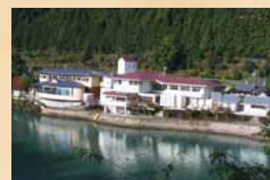
もみじ川温泉 四季を通して彩り豊かな川口ダム湖畔の眺望を楽しめる、静かな温泉です。道の駅も兼ね、地元の特産品も手に入ります。