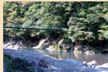
美那川キャンプ村 シーズンにはアユ、アメゴなどの清流の川魚を狙う太公望で賑わう那賀川。そんな清流をたっぷり楽しむ人気の公営キャンプ場です。(開場期間4月20日~9月30日)