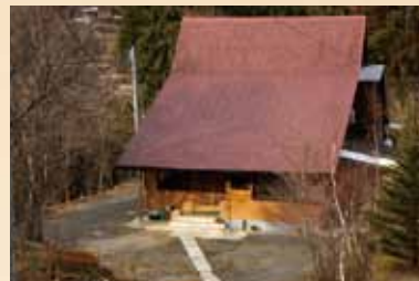
コテージ「みやこわすれ」 農村レストラン「いづりは」 地元の郷土料理が味わえるレストラン。コテージに泊れば、満天の星空が楽しめます。