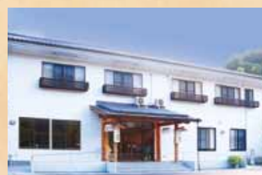
道の宿そわか 太龍寺ロープウェイ山麓駅に隣接する、お洒落さん御用達の宿泊施設。木のぬくもりを感じるアットホームな宿であつくりください。